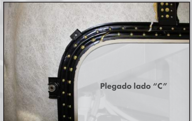
Plegado lado "C"