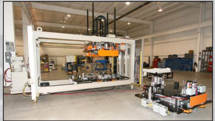
Prensa Plegadora de Bordes Koops con herramental intercambiable