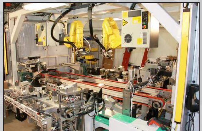
Sistemas de unión/dispensado de pegamento