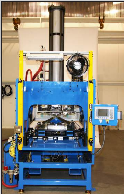
Sistemas de unión por remachado