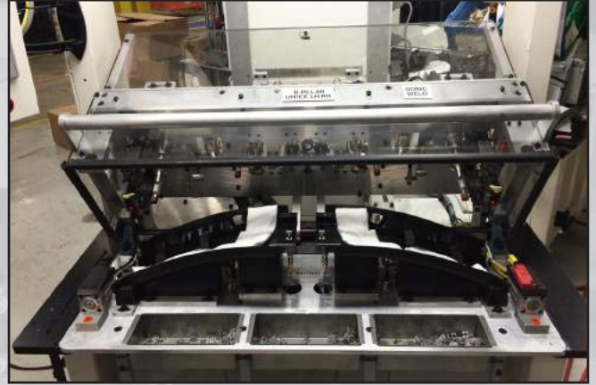
Soldadura por vibración/ultrasónica