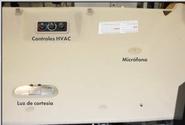
Equipo de prueba final para verificar que los componentes ensamblados y el arnés instalado funcionan adecuadamente