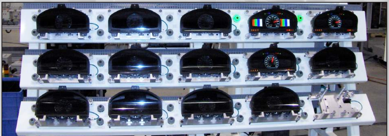
Estación de energizado y prueba final para verificar programa y ensamble correcto de partes